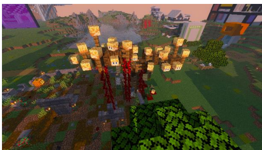
Le cimetière de Vartac par Tutu.