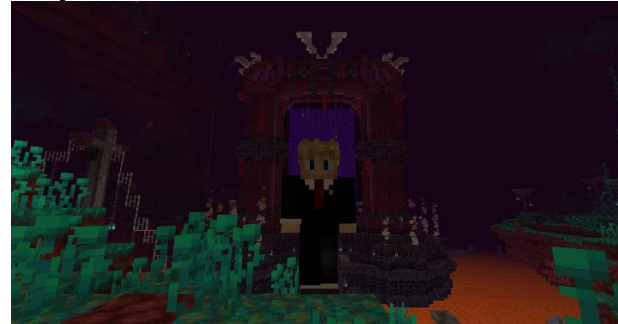
Deux screens du Nether

Mais cette fleur a aussi pu observer quelques événements bien plus tristes, tels que de nombreux décès de citoyens face à la difficulté du Nether ou bien le tout premier procès du serveur opposant un procureur véreux à un citoyen frauduleux.