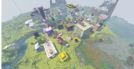
La zone commerciale vue du haut.