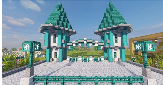
L'entrée du Holy-Parc !