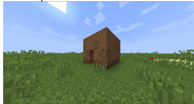
La fidèle reproduction d'un appartement parisien – Builder inconnu