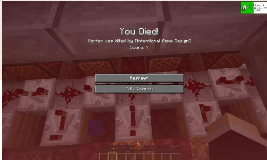
Son dernier écran de mort