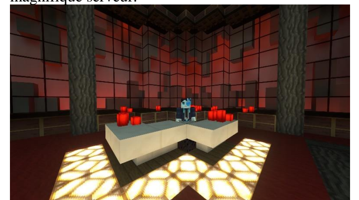
Les studios d'Holy-News – par Aurélien_Sama !

Parmi les éléments du RP ayant donné un petit souffle de vie au serveur on peut citer l'apparition de nouveaux médias (coucou maman, je passe dans le journal) pour tenir les holocubiens informés. L'end, normalement très peu peuplé, n'avait cette fois-ci pas à rougir puisqu'il était peuplé de quelques fermes mais aussi de nombreux vaisseaux spatiaux, appartenant à la Orannacorp mais aussi au village Zhippies. Deux projets qui n'ont pas hésité à explorer le vide spatial à la recherche de ressource, parfois au péril de leur vie (cf : Le jour où les Holocubiens ont trichés ). Bref, vous l'aurez compris, cette saison 5 d'Holocube aura été bien remplie et très appréciée, apportant un grand lot de nouveauté et et nous avons hâte de vous retrouver pour la 6ème saison de ce magnifique serveur.