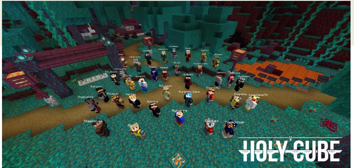
LES JOUEURS DE LA SAISON 5 D'HOLYCUBE – PAR TUNGSTENE74